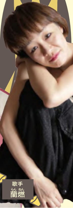
歌手 らん ねん 蘭 燃