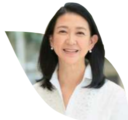
こんのみさこ 紺野 美沙子 氏 俳優・朗読座主宰

東京都出身。夫の両親が岐阜県郡上市出身。1980年、NHK連続テレビ小説『虹を織る』のヒロイン役で人気を博す。俳優として活躍する傍ら、UND P親善大使としても活動中。2010年秋から「紺野美沙子の朗読座」を主宰。NHK-FM『音楽遊覧飛行』案内役を担当。元祖スー女としても知られ横綱審議委員である。2016年1月岐阜県図書館名誉館長に就任。アウトリーチ事業として、岐阜県図書館以外に、近年では各務原市（2023年）、揖斐川町（2024年）などで朗読会を開催している。