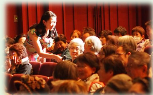
宮城県では、地元で大人気の「シルバー川柳」も披露。 笑いあり涙あり感動のステージ。

2022年12月 阪急交通社主催のツアーイベントでは、 北陸の歴史的建造物である富山県砺 波市の若鶴酒造大正蔵で3日間開催。 映画の名セリフと名曲メドレー、リクエス トコーナーなどクリスマスムード溢れる 楽しい構成で実施しました。