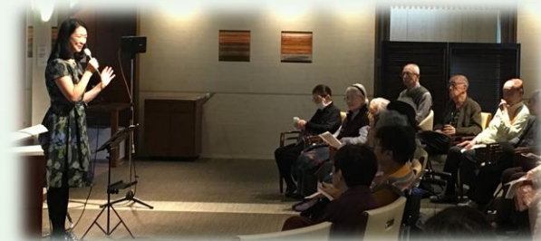
2017年「東急ウエルナ旗の台」 昭和の名曲と共に「詩人・茨木のり子の世界」を上演。