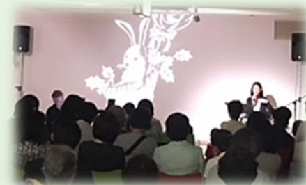
2018年5月(富山) 井波総合文化センターでの本公演前日「オヤヤ子ども食堂」で実施