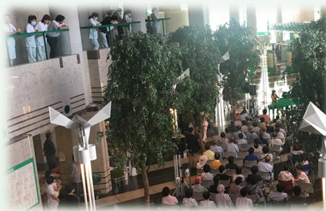
2017年9月(新潟) 新潟テルサでの本公演前日 「長岡赤十字病院」で実施